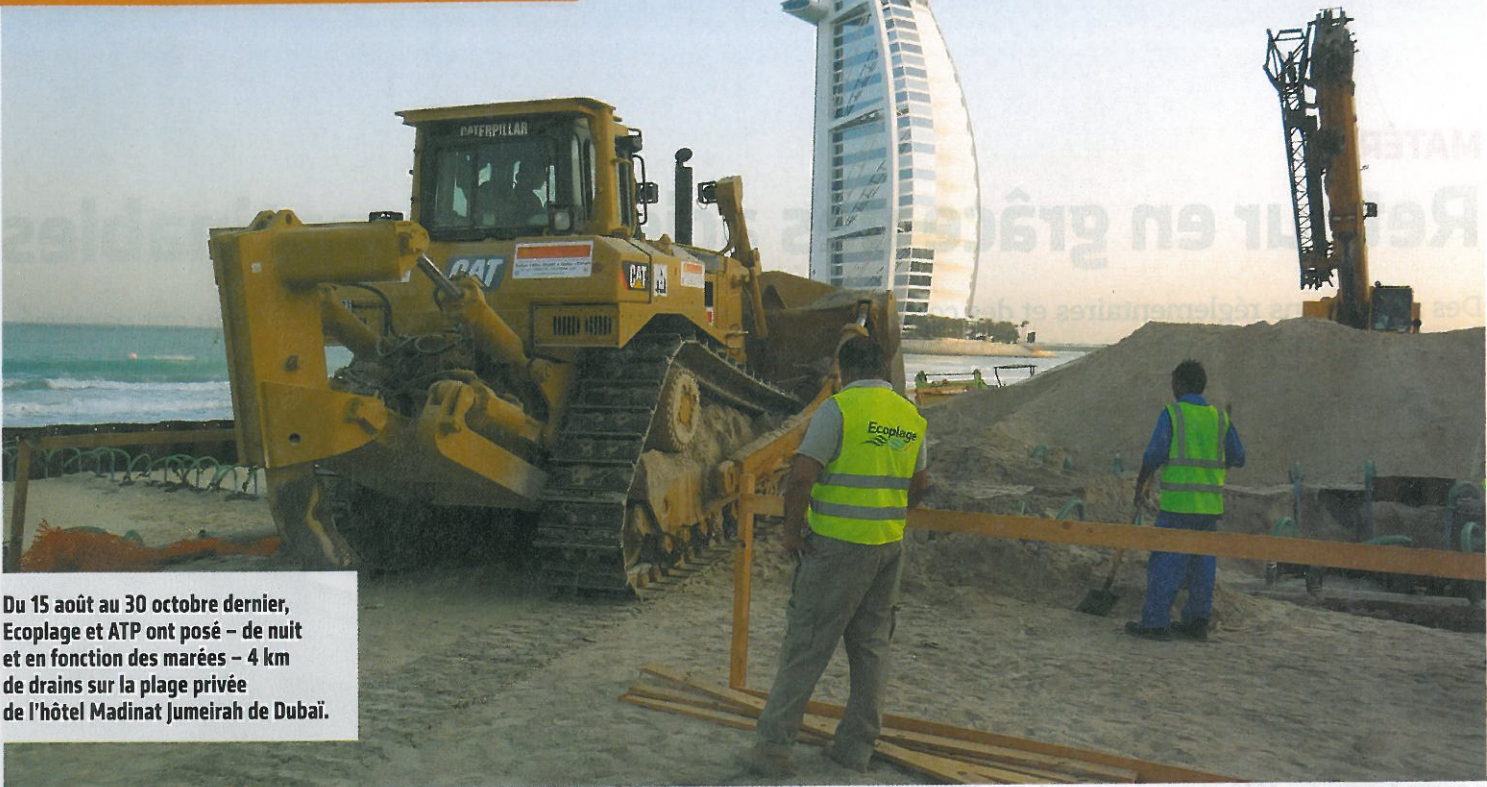
Du 15 août au 30 octobre dernier, Ecoplage et ATP ont posé – de nuit et en fonction des marées – 4 km de drains sur la plage privée de l'hôtel Madinat Jumeirah de Dubaï.